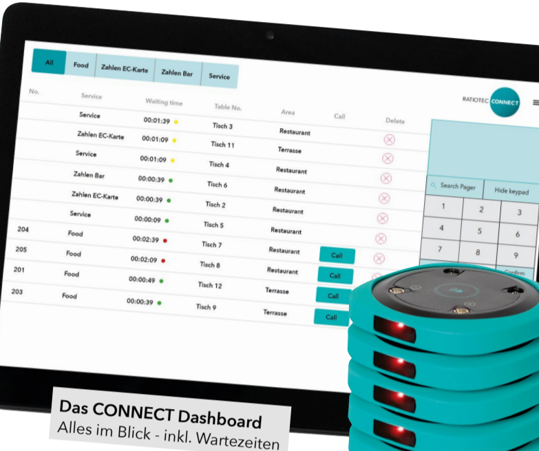
Das CONNECT Dashboard Alles im Blick - inkl. Wartezeiten